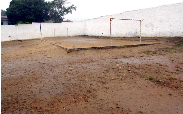
Imagem 05: Quadra da escola: regras específicas e má conservação